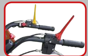
Cambio di Velocità