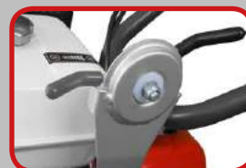
Inversore di Velocità