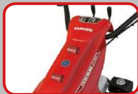
Riduzione delle vibrazioni